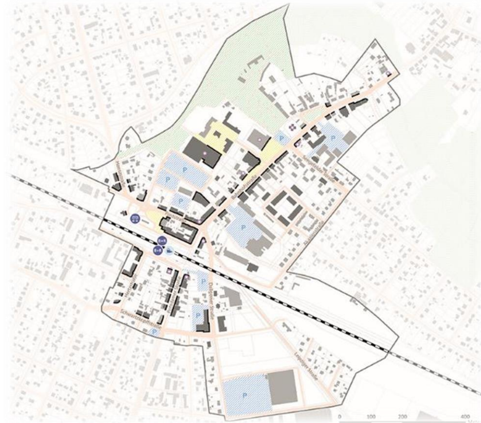
Gebietskulisse Zentrum Falkensee (Grafik: complan Kommunalberatung, kurz: cK, 2020)