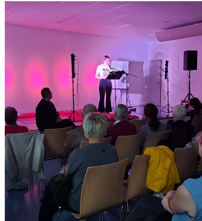
Poetry-Slam der Gruppe Rosenkrieg